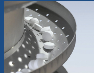
Option: Différentes surfaces de spirale disponibles sur demande