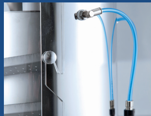
Système de circulation d'air